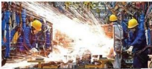
Eskişehirli sanayiciler kritik olan üç aylık süreçte devlet desteği bekliyor.

Eskişehir Sanayi Odası tarafından gerçekleştirilen ve Eskişehir iş dünyasının Nisan, Mayıs, Haziran aylarında beklentilerini ortaya koyan anket sonuçlandı. Anketin sonuçları ESO tarafından raporlaştırılarak kamuoyu ile paylaşıldı.